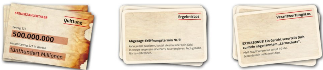
Abbildungen: Beispiele für Steuerzahlertaler, ErgebnisLos und VerantwortungsLos

Das erreichte Spielergebnis kann mit dem Hashtag #flughafenspiel zwischen den Spielern verglichen und als Wettstreit verstanden werden. Damit erhält das Spiel eine weitere Bindungskomponente. Die Plattformen auf Facebook, Twitter und Instagram stehen vollständig zur Verfügung.